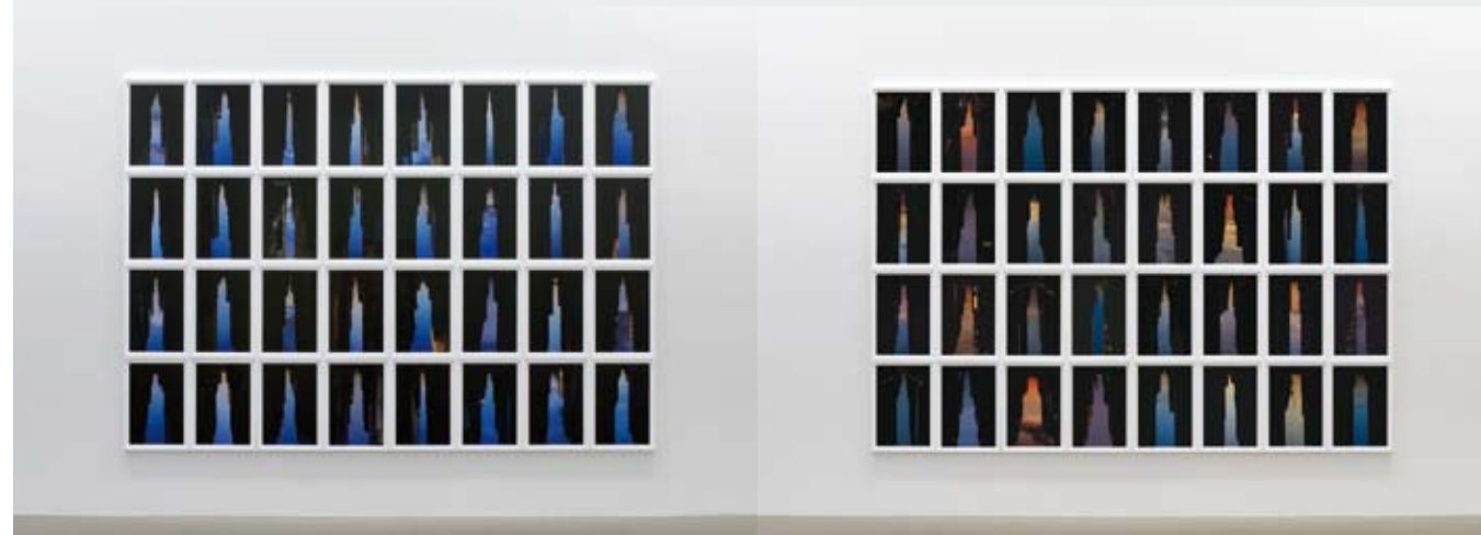
Peter Wegner, Buildings Made of Sky II , pigment prints, 32 units, 225 cm x 319 cm x 3 cm installed, 2009. Galerie m, Bochum, Germany and Kayne Griffin Corcoran, Los Angeles.